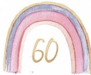
60 Jahre Kita St. Elisabeth 60 Jahre unter einem bunten Regenbogen

Unter diesem Motto feiert unsere KITA ihr Jubiläum. Der Regenbogen ist ein Zeichen des Bundes zwischen Gott und den Menschen. Die Kinder, die unsere KITA besuchen, dürfen dort erfahren, dass Gott auf ihrem Lebensweg immer da ist.